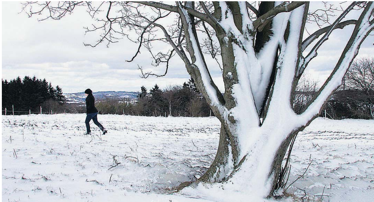
Mit Neuschnee ist gestern Morgen der Winter in die höheren Lagen des Landkreises, wie hier bei Freisen, zurückgekehrt. Für Wanderer angenehmer, als das sonst übliche Schmuttelwetter.