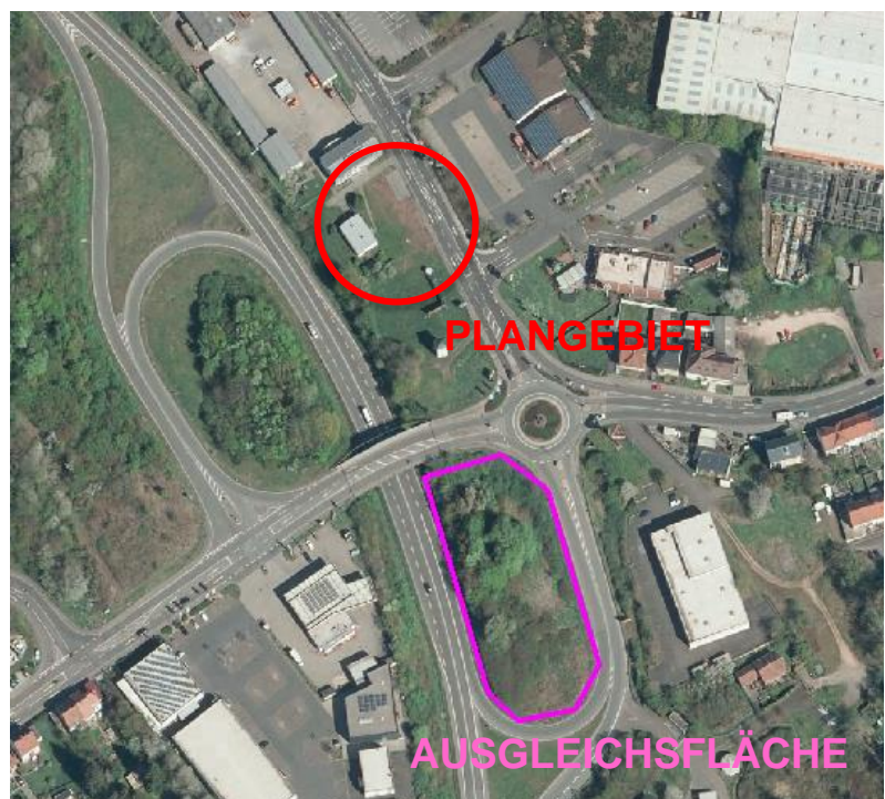
Abbildung 3: Ausgleichsfläche

Da es sich bei dem vorliegenden Bebauungsplan gemäß § 13a BauGB um eine Planung im Innenbereich handelt, gilt der Eingriff gemäß des § 13 a Abs. 2 Nr. 4 BauGB als im Sinne des § 1a Abs. 3 Satz 5 BauGB vor der planerischen Entscheidung zulässig, so dass ein Ausgleich nicht erforderlich ist. Dennoch wird eine Kompensation des Eingriffs in Natur und Landschaft, durch die Pflanzung von 5 Hochstämmen an den Rändern der Ausgleichsfläche der Gemarkung Sankt Wendel, Flur 13 Flurstück 49/16, vorgenommen. Die Ermittlung des Ausgleichs erfolgt verbal-argumentativ und wird in dem städtebaulichen Vertrag vereinbart. Die Ausgleichsfläche befindet sich, wie aus Abbildung 3 ersichtlich, in unmittelbarer Nähe des Plangebietes.