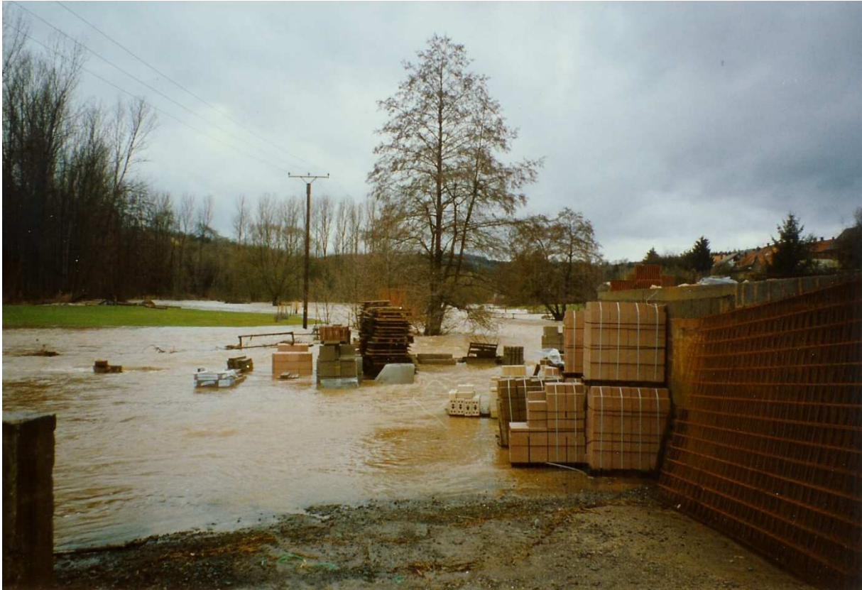
Unsachgemäße Lagerung in Überflutungsbereichen