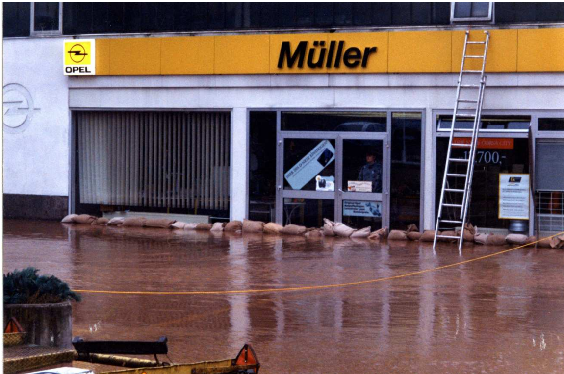
Schadenspotenzial durch Bebauung in Überschwemmungsgebieten